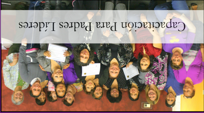
Capacitación Para Padres Líderes