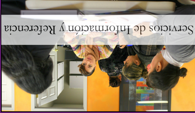
Servicios de Información y Referencia